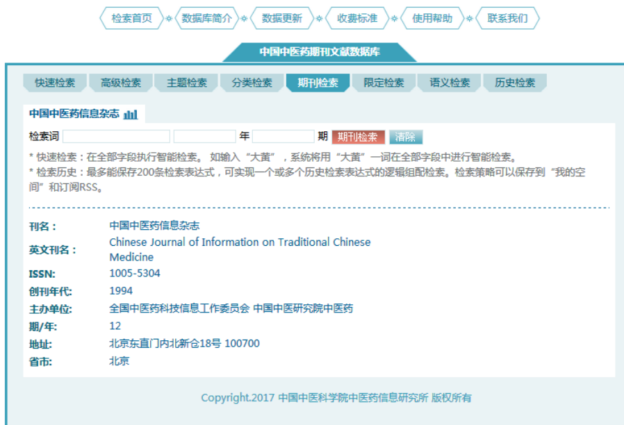
图 1 单库检索界面