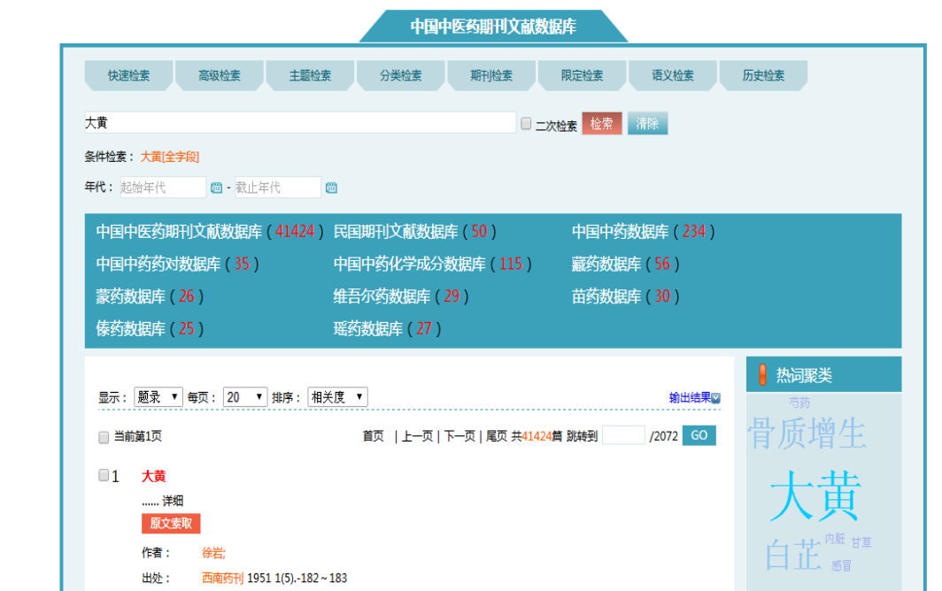
图 2 多库检索